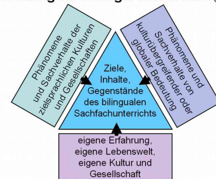
Das Bilingual Triangle nach W. Hallet (1998)